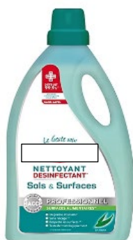
Nettoyant désinfectant sol et surface