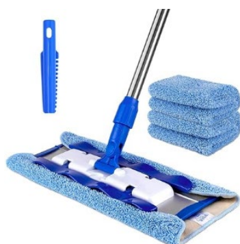
Balai de lavage