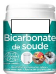
Bicarbonate de soude