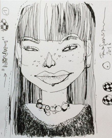
15. Felix Scheinberger (1969-), dessin préparatoire de couverture, 2016.

Couverture du magazine « Novum ». Chaque couverture est peinte à la main. Il a fallu 4 jours de travail à l’artiste Felix Scheinberger pour mettre en couleur les 13 000 exemplaires imprimés en Offset, à la brosse et à l’encre. Le résultat : chaque numéro est une œuvre unique. « Novum – World of Graphic Design » est un mensuel allemand. Ce magazine est publié depuis 1924 et traite de l’actualité en matière de design graphique.