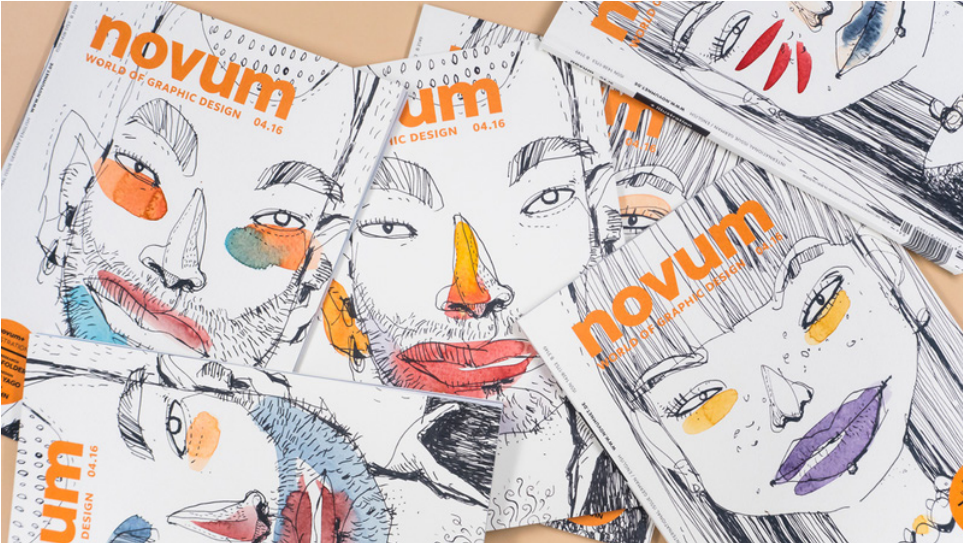
16. Felix Scheinberger (1969-), couvertures du magazine Novum, avril 2016. aquarelle sur tirage Offset.