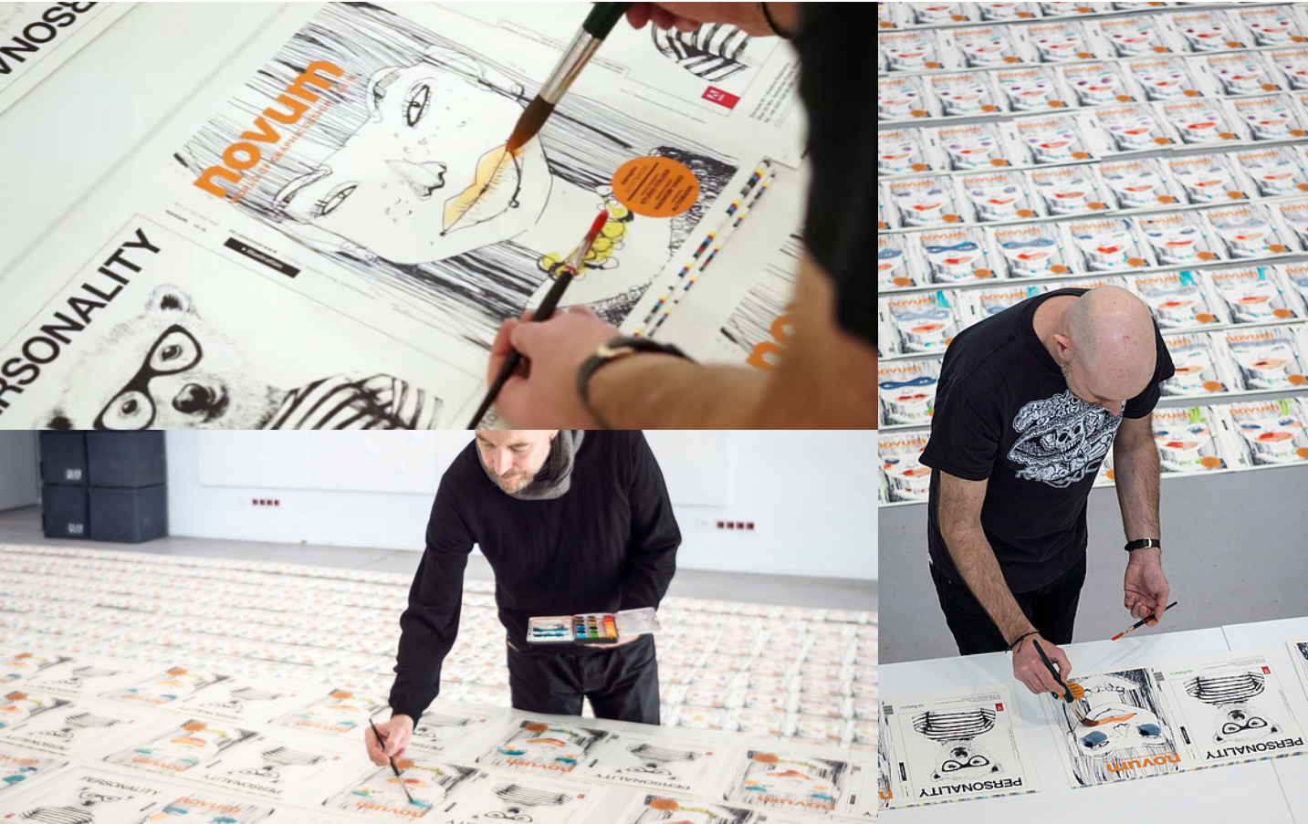
17, 18 et 19. Felix Scheinberger (1969-) personnalisant les unes du magazine « Novum », 2016, encre sur couverture Offset. Les première et quatrième de couverture sont coloriées par l’artiste à l’encre.

Expliquer le processus de création de la une de couverture du magazine « Novum ». Vous commencerez votre description du dessin de l’artiste jusqu’à la couverture finale. Justifier votre réponse à l’aide des documents fournis. /3 pts