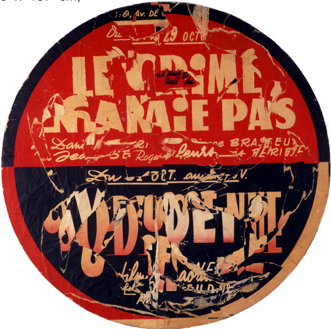
14. Jacques Villeglé (1926-2022), Rue de Tolbiac, le crime ne paie pas, 26 octobre 1962. Affiches lacérées marouflées sur contreplaqué, 73 x 51 cm, collection particulière.

Question 2.1 Rédiger un texte expliquant les similitudes entre les objectifs de production artistique de Jacques Villeglé et les artistes Man Ray et Marcel Duchamp (voir documents 6 et 7 sur la page précédente). /2 pts