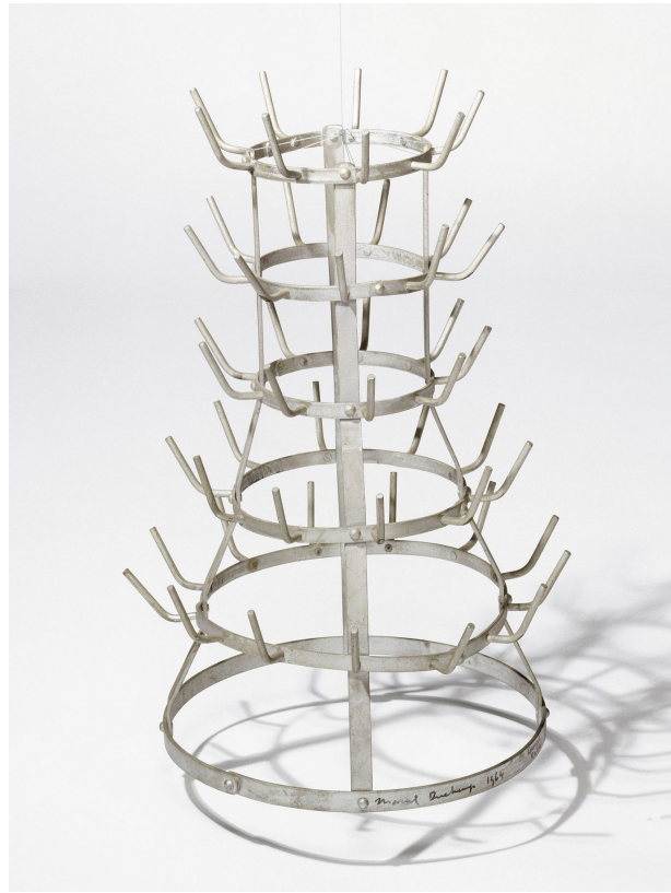
Marcel Duchamp (1887-1968), Porte-bouteilles , 1917, sculpture, fer galvanisé, environ 64 x 42 cm, Centre Pompidou, Paris.

Ces images pourront servir à votre analyse et nourrir votre réflexion.