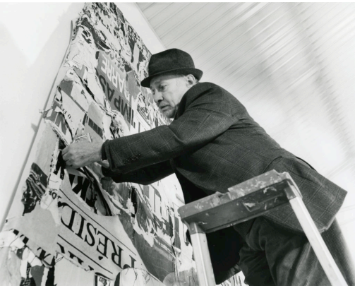
12. Jacques Villeglé (1926-2022) marouflant une affiche lacérée de grand format, 2008.