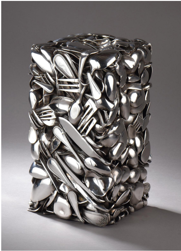
César (1921-1998), Compression de couverts en métal argenté , 1975, sculpture, métal argenté, 29 x 15,5 x 15,5 cm, Collection particulière.