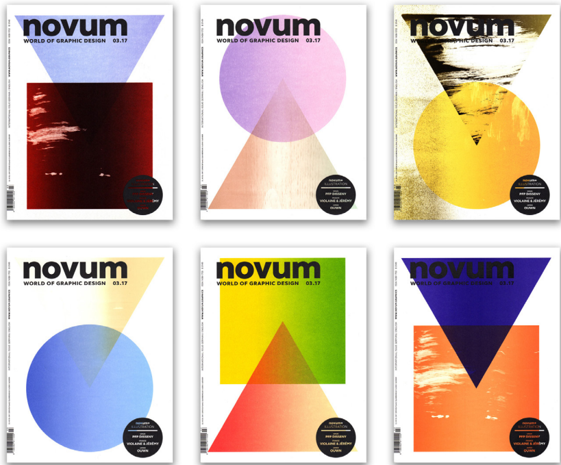
Studio Marcus Kraft, Une de couverture Magazine Novum , 2017, impression Offset. Élaboration de 4 motifs présentant des combinaisons de formes géométriques. Le studio Marcus Kraft intervient artisanalement lors de l'impression offset pour créer des éclaboussures, changer l'intensité ou la tonalité des couleurs, modifier la surface à imprimer.