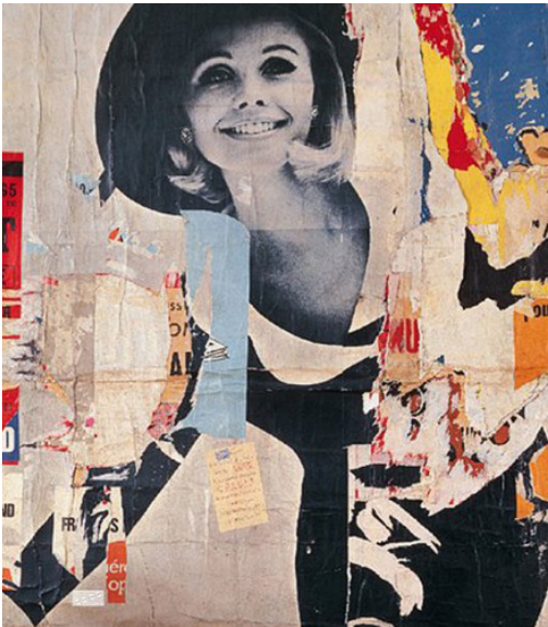
13. Jacques Villeglé (1926-2022), Rue Desprez et Vercingétorix - La Femme, 12 mars 1966, 251 x 224 cm, Centre Pompidou, Paris