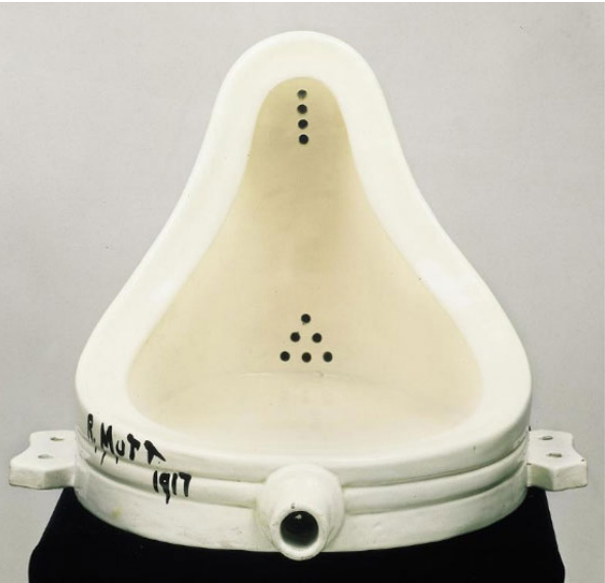
6. Marcel Duchamp (1887-1968), Fontaine , 1917, faïence blanche recouverte de glaçure céramique et de peinture, 63 x 48 x 35 cm, Centre Pompidou, Paris.

Dans ce contexte d’uniformisation, les artistes des avant-gardes vont redéfinir le statut de l’œuvre d’art à travers l’objet et son aspect unique.