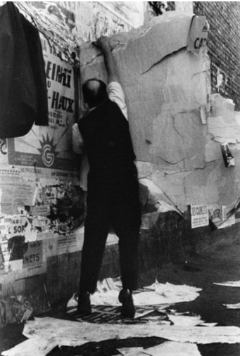
10. Jacques Villeglé (1926-2022) déchirant des affiches à Montparnasse, 1961.

Définition Lacérer : déchirer, mettre en pièces du tissu, du papier (Larousse).