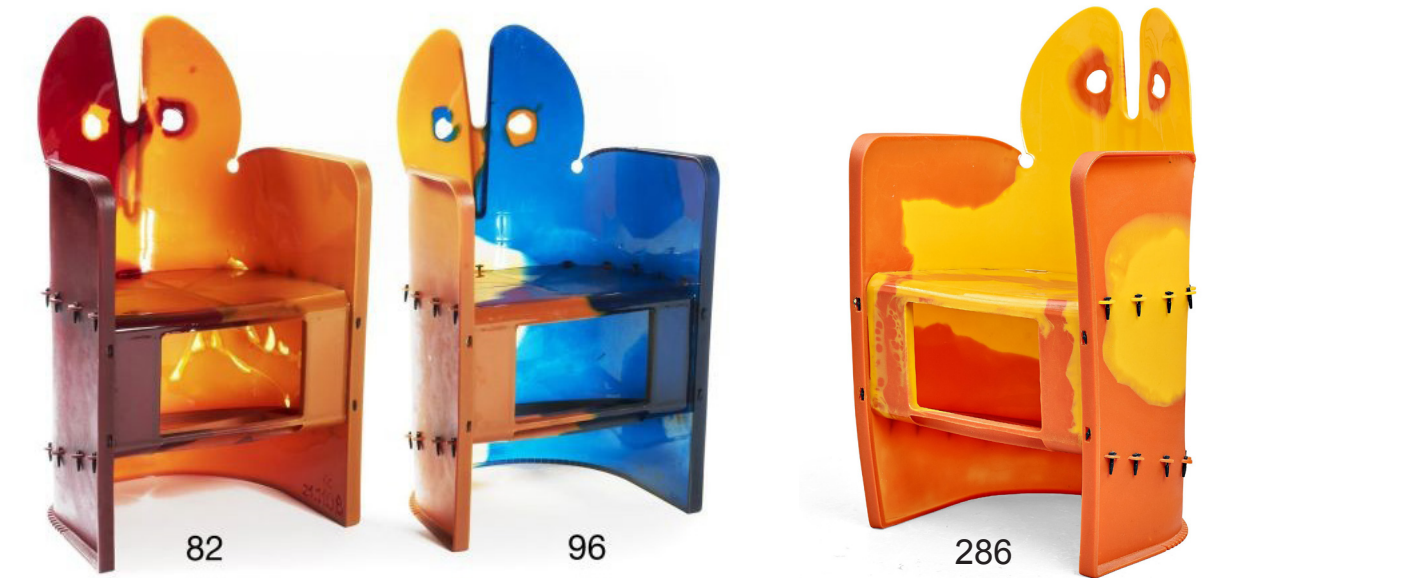
Gaetano PESCE (1939-2024), Nobody's perfect , Édité par Circa, 2000. Chaise en résine teintée et injectée, 89 x 51 x 48 cm. Chaque chaise est rendue unique par l'injection aléatoire de résine colorée.

Partie 1 : réflexions autour des contextes historiques, culturels, socio-économiques, dans le domaine de la communication visuelle / SUR 20 POINTS. Partie 2 : analyse comparative / SUR 20 POINTS.