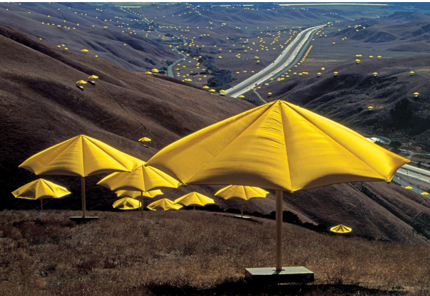
Christo (1935-2020) and Jeanne-Claude (1935-2009), The Umbrellas, Japan - USA, 1984-1991, installation éphémère, Californie, États-Unis. Chaque parasol mesurait 6 mètres de haut, pour 8,60 mètres de diamètre.

Partie 1 : réflexions autour des contextes historiques, culturels, socio-économiques, dans le domaine de la communication visuelle / SUR 20 POINTS. Partie 2 : analyse comparative / SUR 20 POINTS.