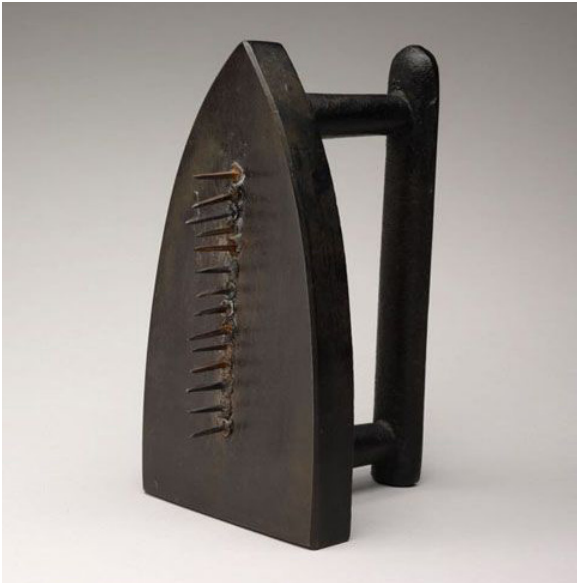
7. Man Ray (1890-1976), Cadeau , 1921, fer à repasser en métal et clous collés, 7,5 x 10 x 14 cm, Centre Pompidou, Paris.

Comment se nomme le type d’œuvre d’art (documents 6 et 7) qui consiste à s’approprier un objet en le détournant de sa fonction première ? /1 pt