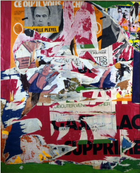
11. Jacques Villeglé (1926-2022), Rue du Parc Royal, 1975. Affiches lacérées contrecollées sur toile, 170 x 137 cm, collection particulière.