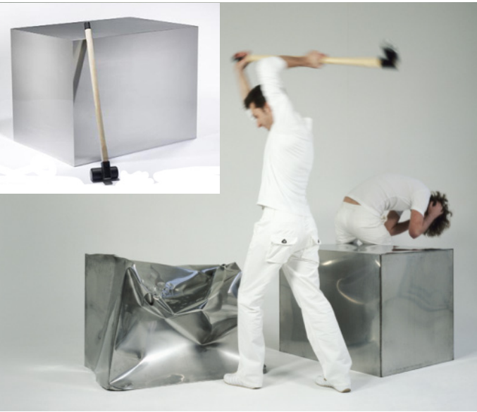
8. Droog Design - Marjin Van Der Poll, Hitchair , 2000, inox argenté, 100 x 70 x 75 cm.

Pourquoi, selon vous, ces artistes remettent-ils en cause les conventions artistiques de leur époque ? /2 pts